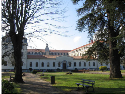
Cité des Arts, Bayonne

A Pessac (UMR Passages) : Mme Sylvie VIGNOLLES, Maison des Suds 12 esplanade des Antilles 33607 Pessac Cedex: +33 (0)5 56 84 68 36 Sylvie.vignolles@cns.fr