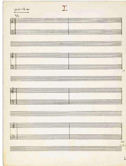
4'33", John Cage, for solo piano (1952) reconstruction by David Tudor, p. 1, ca 1989