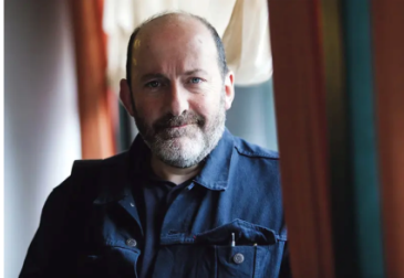
Pat Collins, réalisateur

Seine Reise wird zu einer Initiation, seine Begegnungen führen ihn fort von der klanglichen Naturbeobachtung hin zu einer "anderen immateriellen Stille", verklanglichter Geschichte(n): Was habe ich hinter mir gelassen um mir mein Leben aufzubauen? Beeinflusst von Elementen aus der Folklore und angereichert durch zahlreiche Archivadokumente lädt uns Silence ein auf die poetischen Landschaften der Stille Irlands zu hören, die ebenso einnehmend wie unruhig sind und uns bis auf die Inseln von Aran führen, wo das Hören auf die Natur zu einer Form der Selbsterkenntnis wird.