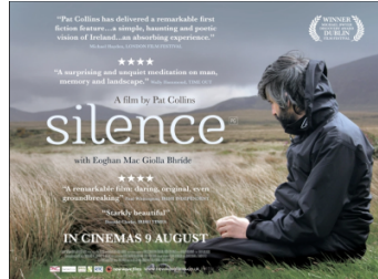
Silence (Irlande-Allemagne, 2012)