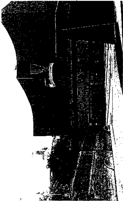
Ich eine ige: der sue Bus er Phil- landort insie- zentrale as Knitz