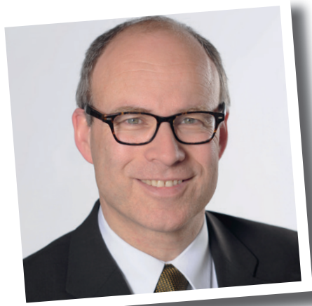
Senator Ties Rabe Präsident der Kultusministerkonferenz

Das alles ist unabdingbar, aber eben auch nicht einfach, wenn man die gleichzeitig notwendigen Anstrengungen sieht, die aufgrund des starken Anstiegs der Zahl der Studienanfängerinnen und -anfänger zu meistern sind.“ www.hrk.de